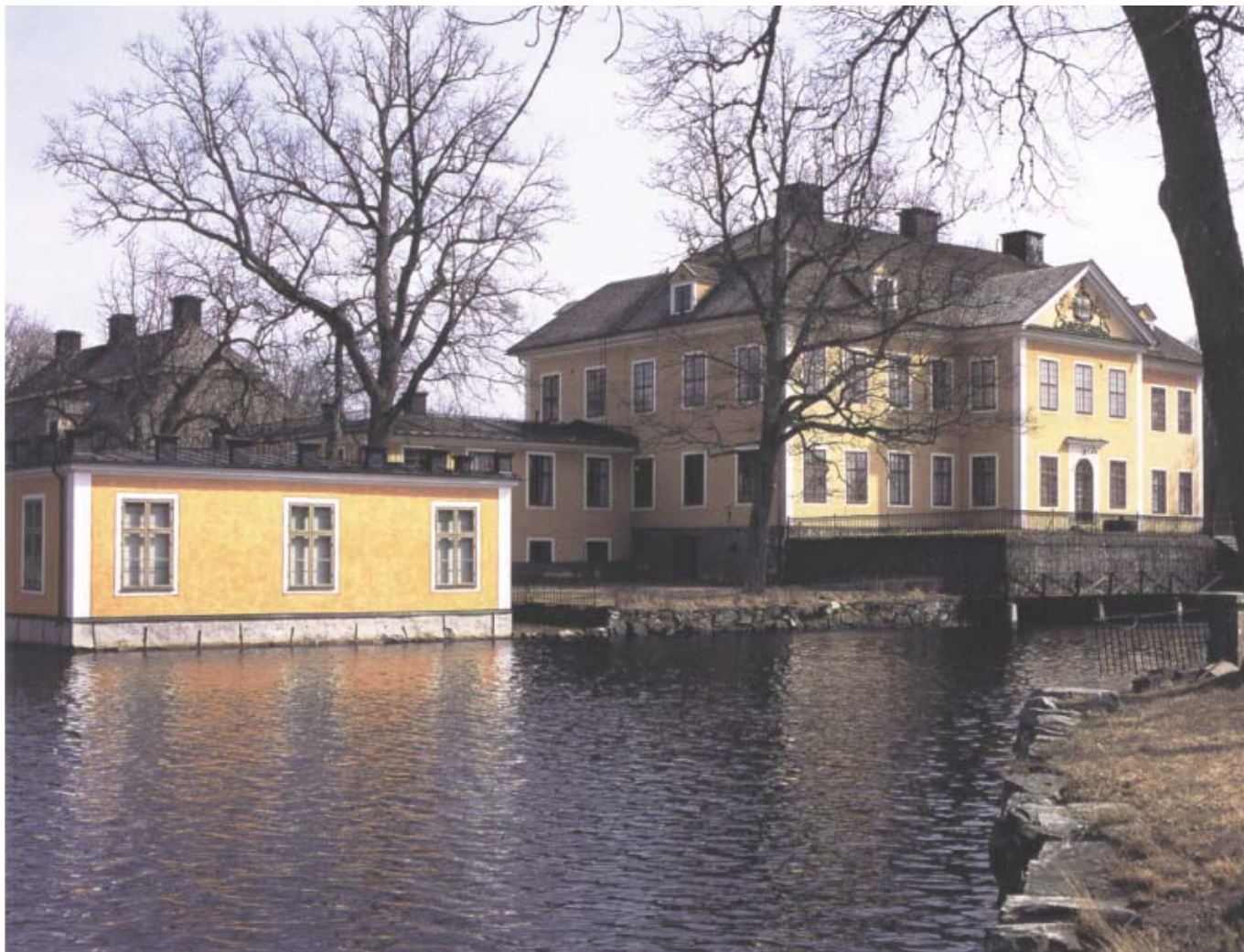
Den nya herrgården byggdes upp i sten efter rysshärjningarna 1719. Invid kanalen framför herrgården ligger biblioteket och naturaliekabinettet i paviljonger ritade av Jean Eric Rehn på 1750-talet.

neras av vallonerna, och därför talar man om 'vallonbruken'.