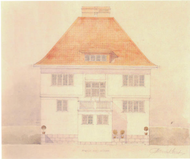
Ritning av Torben Grut till den egna villan "Sunnanlid" som byggdes 1906 på Djurgården i Stockholm.

och sin danska bakgrund blev han en av de första svenska arkitekterna som uppmärksammade 1890-talets danska tegelarkitektur. En arkitektur som, inte minst genom Martin Nyrops rådhus i Köpenhamn, fick stor betydelse för den svenska nationalromantikens tegelbyggnad.