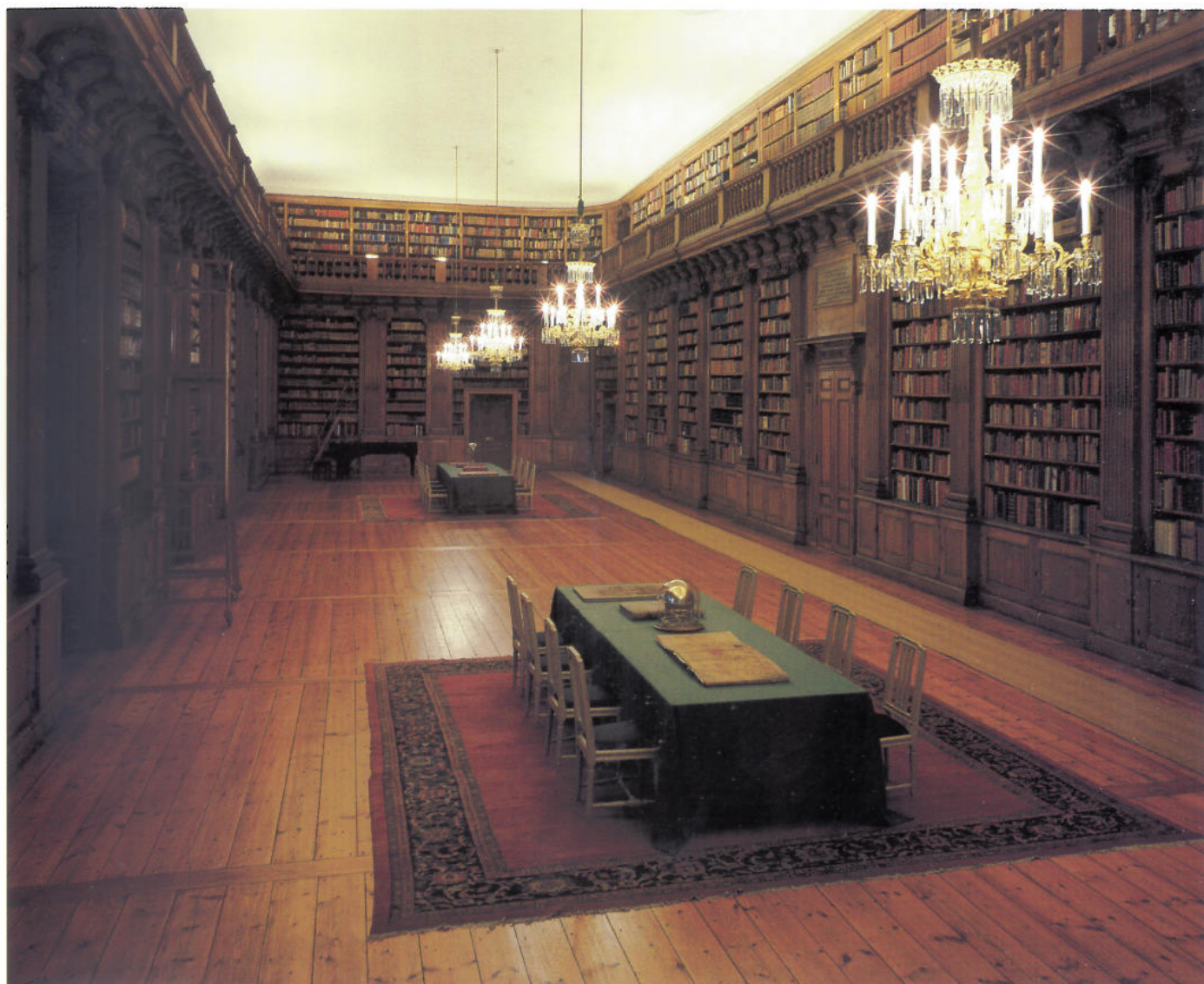
Stora bibliotekssalen i Stockholms slotts nordöstra flygel. Fram till 1878 var den centralrummet i Kungliga biblioteket. Här finns nu Bernadottebiblioteket.

1920 av arkitekten Axel Anderberg men av detta utfördes bara två flyglar, en vid vardera gaveln. Samtidigt genomfördes ombyggnader i den ursprungliga byggnaden.