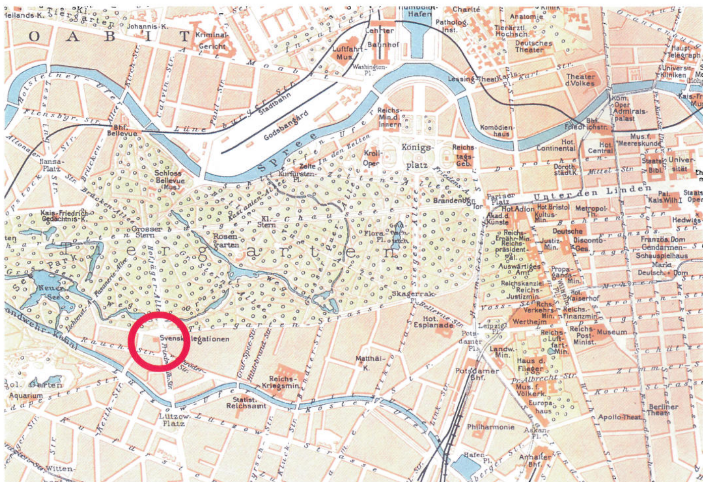
Berlin före andra världskrigets utbrott. På kartan finns bland annat svenska legationen och de tyska regeringsbyggnaderna vid Wilhelmsstrasse utsatta.