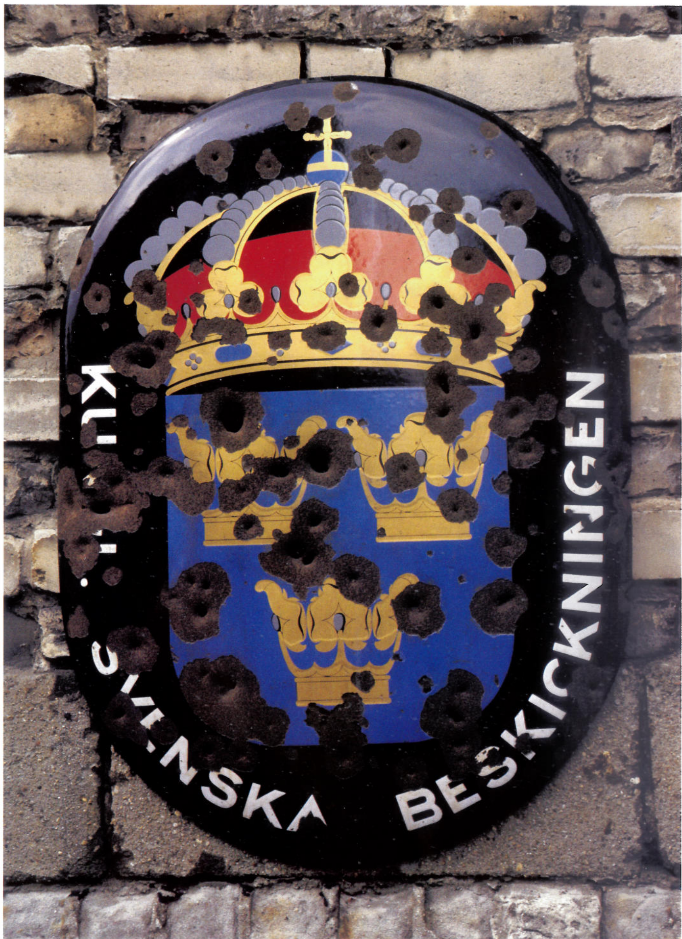
Den gamla legationsskylten med märken av skott och granatsplitter finns bevarad i Bonnambassadens filial i Berlin.