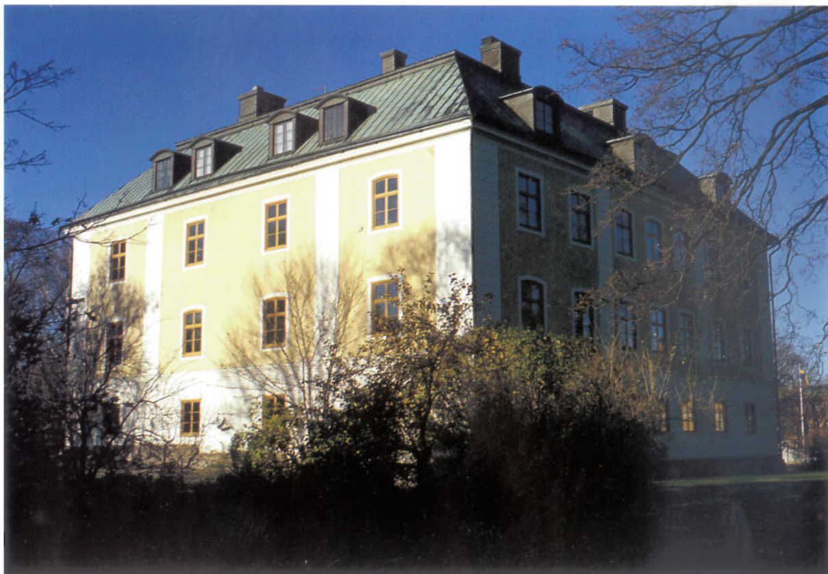
Gävle slott efter fasad- renovering.

Under sonen Carl Sparres tid som landshövding, han tillträdde 1763, anlades en terrasserad trädgård mellan flyglarna. Under Sparrarnas tid fortsatte också inredningsarbetena i slottet.