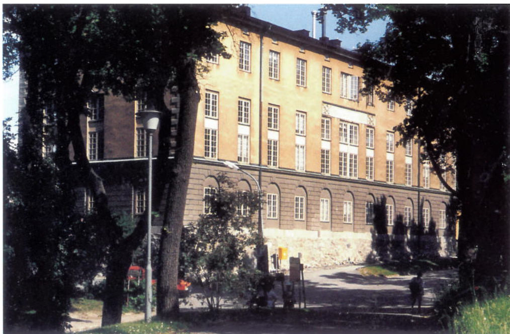
Kasern II eller Båtsmanskasernen på Skeppsholmen i Stockholm byggdes åren 1816–19.

flottan, och 1805 löjtnant mekanikus för att 1808 befordras till kapten.