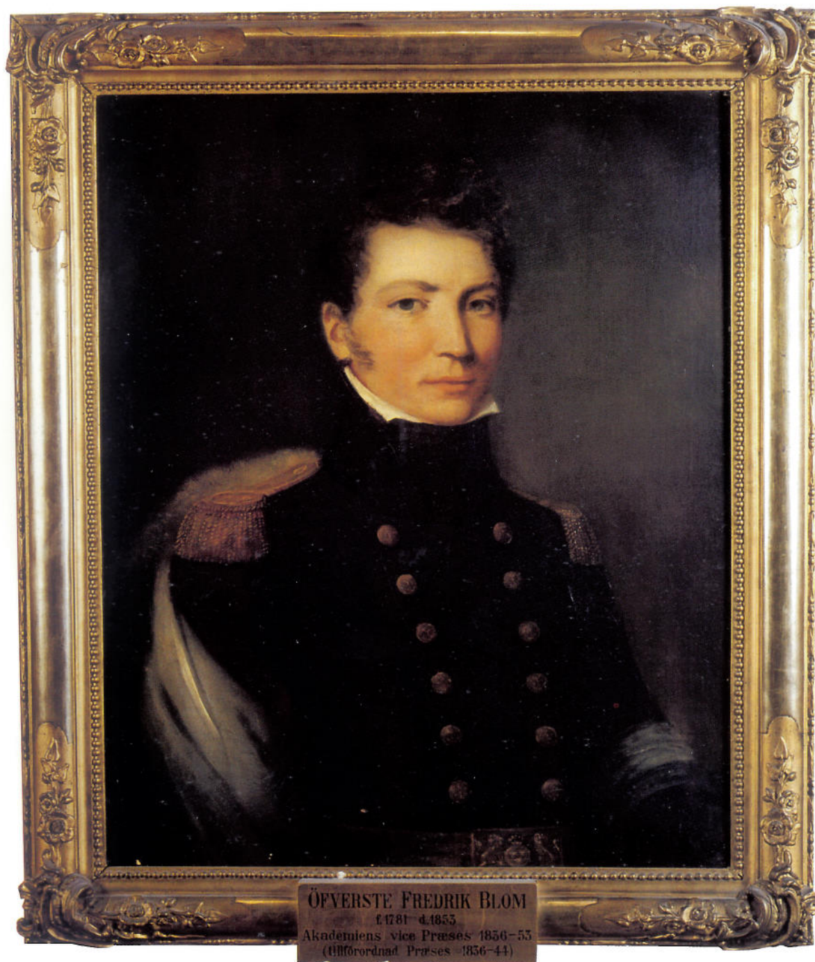
Porträttet som finns i Konstakademien är målat av Fredrik Westin.