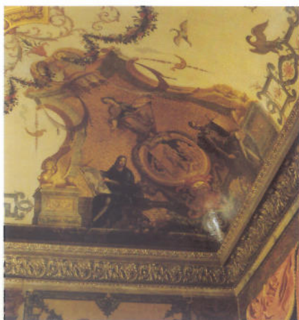
Detalj av det praktfulla, målade taket med allegoriska figurer. Konsten representeras av en skön gudinna med pensel och palett och av målaren Rafael vid skissblocket.