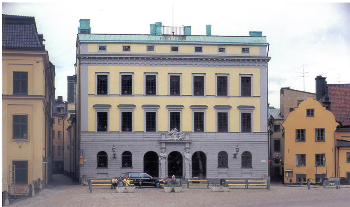
Den diskreta fasaden avslöjar ingenting av all den prakt Nicodemus Tessin d.y. skapat inne i palatset.

hade gjort studieresor till Italien och Frankrike, beundrat Michelangelo och Berninis romerska palats, Le Nôtres parkanläggningar och praktrummen i Versailles.