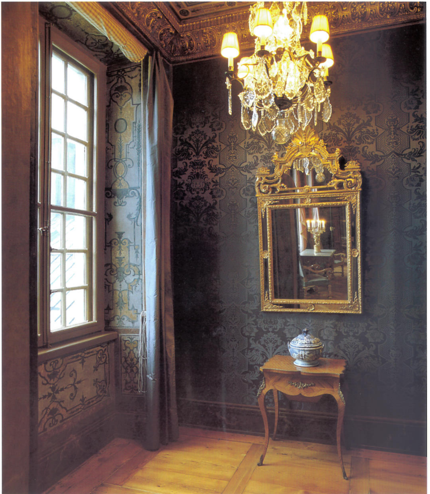
Blå Kabinettet med sidentapeter och målad dekor i fönsternischerna, gammalt furugolv i ruttmönster. Barockspegeln är av en typ som i Sverige utfördes på Burchardt Prechts verkstad. Ljuskröna i barock. Litet rokokobord och terrin i kinesiskt kompaniporslin.

Den tomt Nicodemus Tessin hade att bygga sitt palats på var mycket liten. Därför strävade han efter att förstora intrycket, så att anläggningen skulle få mera ståndsmässiga proportioner. Med snedställda gavlar som förvrängde per-