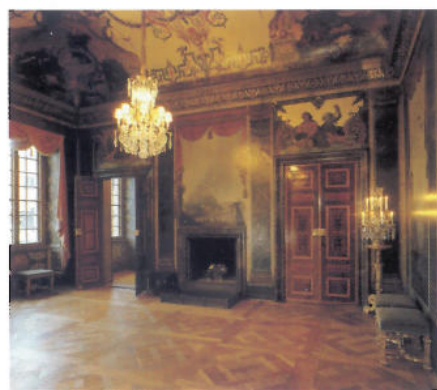
Festsalens väggar är täckta av italienska landskapsvyer inramade av målade gardiner som härmar de riktiga runt fönstren. Fouquet, Chauveau och de Meaux heter de skickliga franska konstnärer som dekorerat festsalarna. Ljuskrone i barock och parkettgolv i rut-mönster, allt som på Tessins tid.

Nicodemus Tessin d.y. köpte tomten i hörnet av Slottsbacken och Köpmangatan i september 1692. Då var han 38 år gammal och mitt uppe