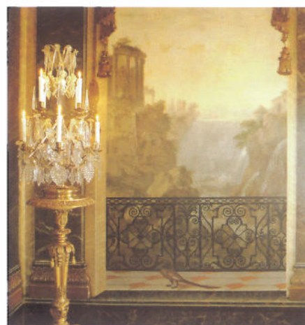
En romantisk landskapsvy med klippor och tempelruin tonar bort bakom det sirligt målade järnräcket. Trompe l'œil , att lura ögat, var en populär sport bland tidens målare.

i Frankrike,” skrev han stolt. Samma år brann det gamla kungaslottet ned till grunden – om slottsarkitekten själv möjligen hade ett finger med i spelet lär man väl aldrig få veta säkert.