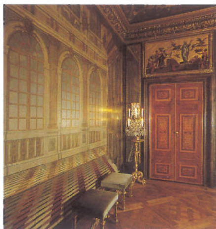
Paradesängkammaren som ingår i rumssfilen av praktgemak har en effektfull väggmålning som vidgar rummet. Arkitekten Nicodemus Tessin lurade gärna åskådarens öga med skenperspektiv.