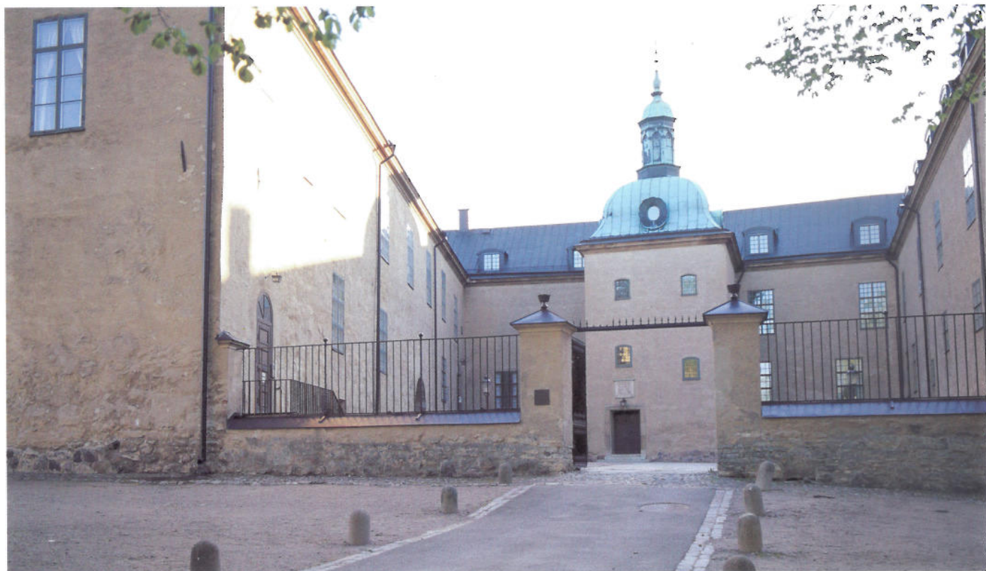
Linköpings slott restaurerades 1931-32 under ledning av arkitekt Erik Fant. Exteriören fick då sitt nuvarande utseende som till stor del överensstämmer med hur slottet såg ut efter ombyggnad och renovering under 1700-talet.

tre dagar och tre nätter tog kungen för sig av vad som fanns av förråd och pengar innan han drog vidare.