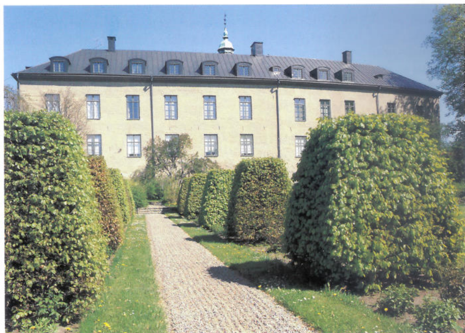
Slottsträdgården har anor från medeltiden och under biskop Brasks tid var den vida berömd för sina fruktodlingar. Under 1900-talets början omgestaltades den av Rudolf Abelin, som var dåtidens ledande trädgårdsarkitekt. När slottet restaurerades i början av 1930-talet förenklades den abelinska anläggningen.