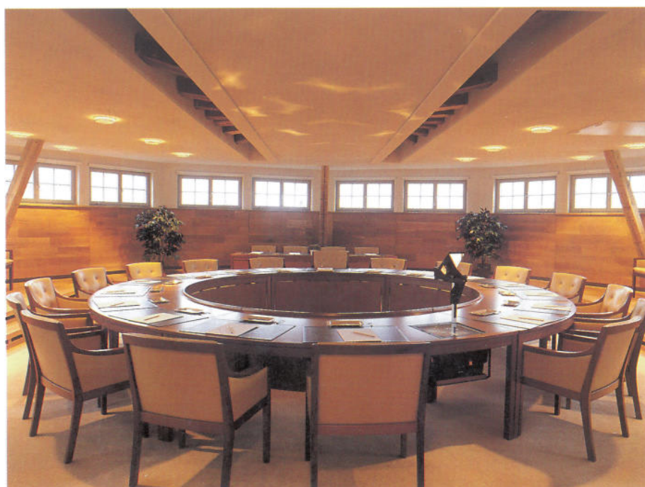
Länsstyrelsens nya sessionssal i nordöstra tornet.

Gustav Vasas yngste son hertig Karl, som till slut blev Karl IX efter att ha överlevt sina två bröder Erik och Johan, fick ära Örebro hus efter sin far. Örebro låg inom Karls hertigdöme som omfattade Södermanland, Värmland, största delen av Närke samt delar av Västmanland