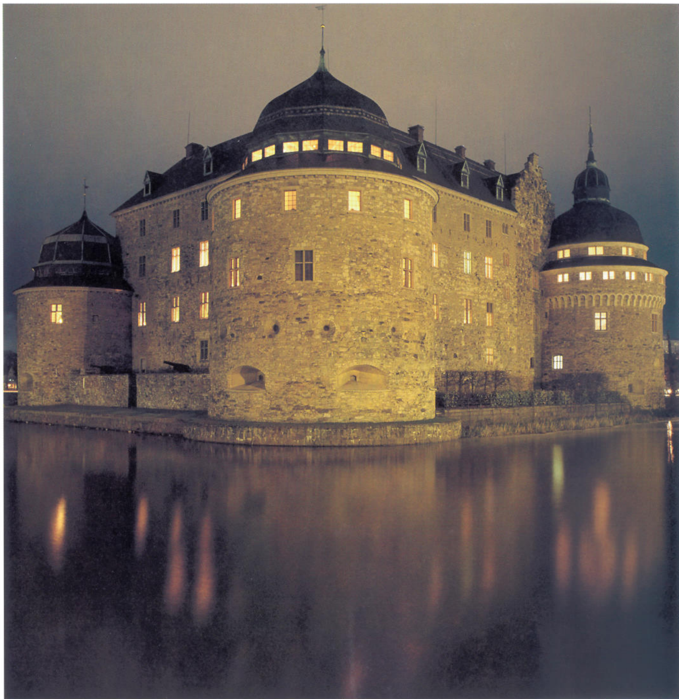
Slottet mot nordväst. I bakgrunden museitornet och omedelbart till vänster om detta trappgaveln som markerar det gamla hörntornet.

rande om ett befäst hus – det slutande 1500-talet var ju i högsta grad oroliga tider. Slottets yttermurar fick en kärv fortifikatorisk prägel, men mot borggården fick fasaderna en rik skulptural utsmyckning.