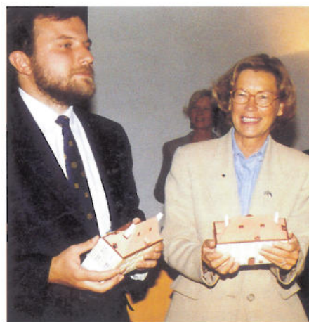
Sveriges ambassad i Tallin invigdes den 16 augusti. Både utrikesminister Margareta af Ugglas och Estlands utrikesminister Jüri Luik var närvarande vid det historiska tillfället.