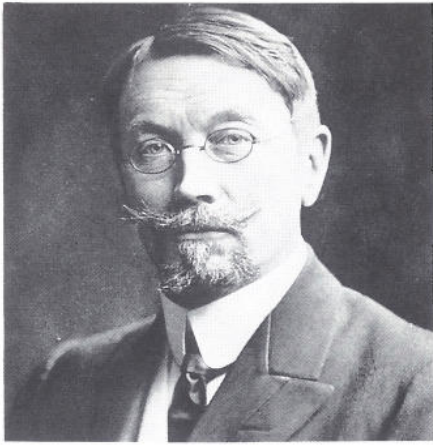
Isak Gustaf Clason. Arkitekt, upphovsman till Nordiska museets byggnad. Professor i arkitektur vid KTH 1890–1904. Intendent i Överintendentsämbetet 1905–17. Byggnadsråd i Byggnadsstyrelsen 1918–25. Preses i Konstakademien 1918–30.

de med undervisning om gammal svensk byggnadskultur vid Konsthögskolans arkitekturskola, från 1912 som professor i den svenska arkitekturens historia.