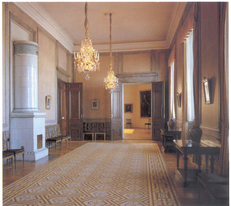
Arvfurstens palats, som förvaltas av Statens fastighetsverk, blev byggnadsminnesmärke 1935. Det restaurerades 1948-52 med Ivar Tengbom som arkitekt och Carl David Moselius som antikvarisk expert. Då återställdes de inredningar som utfördes på 1790-talet för prinsessan Sofia Albertina efter ritningar av Eric Palmstedt och Louis Masreliez.