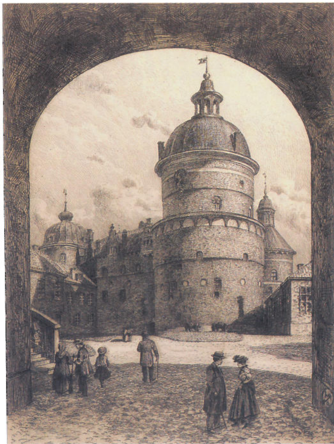
Gripsholms slotts yttre borggård 1902.

ska också ses mot bakgrund av det ökade intresse för den gamla svenska byggnadskonsten som uppstod bland arkitekter och konsthistoriker under slutet av 1800-talet. Anledningarna var flera, men grundläggande var de romantiska och nationella stämningar som rörde sig i tiden. Viktiga upptäckter blev Gotlands rika bestånd av närmast orörda medeltids-