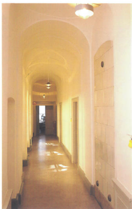
Korridor i den Hårlemanska tillbyggnaden.

en tvärbyggnad så att en innergård skapades. Gården ägnades mycken omsorg med pilastrar och kapital. Den gård vi ser i dag är en våning högre än den Tessin d y skapade. På gården anlades även en brunn.