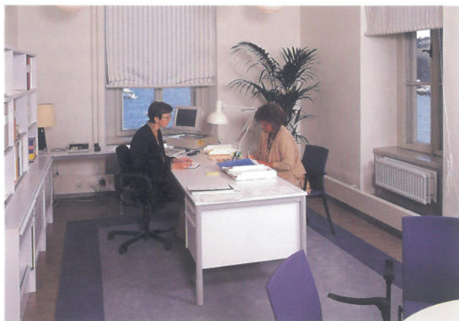
Arbetsrum i den Hårlemanska tillbyggnaden.

Hårlemans uppdrag var begränsat till tre våningar i tomtens östra del där det stod ett packhus från 1603 som revs. Två stentavlor från huset sparades och finns inmurade i entrén från Skeppsbron. Längre och ingående diskuterades grundläggningen. Fullmäktige hade ju i tillbyggnaden sett problemen och så här nära vattnet var man noga med att hitta en god lösning. Pålar- nas form, längd och skoning var föremål för noggranna överväganden med flera experter. En kopia av