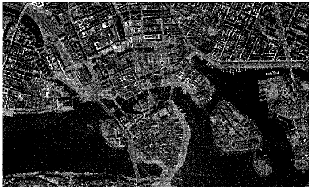
SFV:s förvaltning i innerstaden

SFV förvaltar statliga symbolbyggnader i Stockholm som centrala museer, teatrar, domstolsbyggnader, byggnader för statlig förvaltning och Stockholms slott. SFV förvaltar även Riddarholmen, Skeppsholmen och delar av Nationalstadsparken. Fastighetsbeståndet berättar om den historiska utvecklingen av statens funktioner i huvudstaden. De flesta miljöerna är statliga byggnadsminnen. Miljöerna är attraktiva besöksmål och bidrar till att göra Stockholm till en kulturstad.