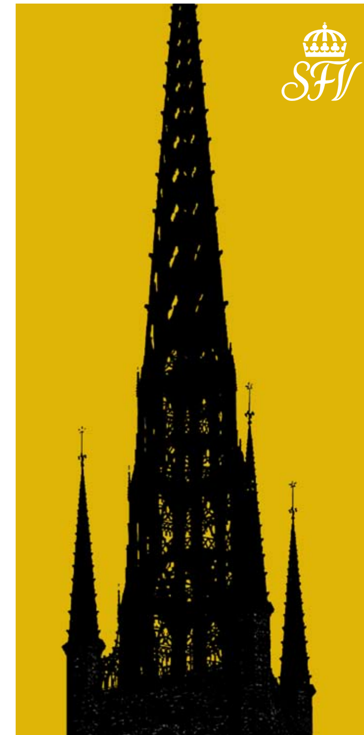
SFV, maj 2007