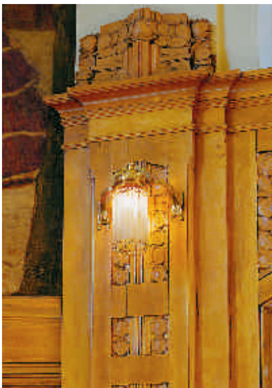
Interiör i wienerjugend i Paulicaféet.