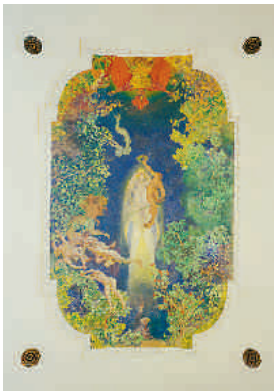
Carl Lassons målning i marmorfoajéns tak.