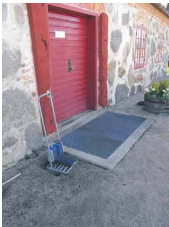
En skoskrapa framför entrén på Huseby bruk uppmuntrar besökare och personal att torka av skorna från snö och lera. Då blir det automatiskt mindre att städa inomhus.

Tips! Ibland hittar man småbitar som kan komma från en möbel, tavla, list eller skulptur. Ta genast hand om biten, lägg den i ett kuvert eller plastpåse och märk påsen med text om var du fann den, datum och namn. Vet du var