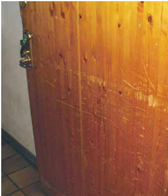
Denna dörr i ett statligt byggnadsminne från 1960-talet har blivit ovarsamt behandlad upprepade gånger.