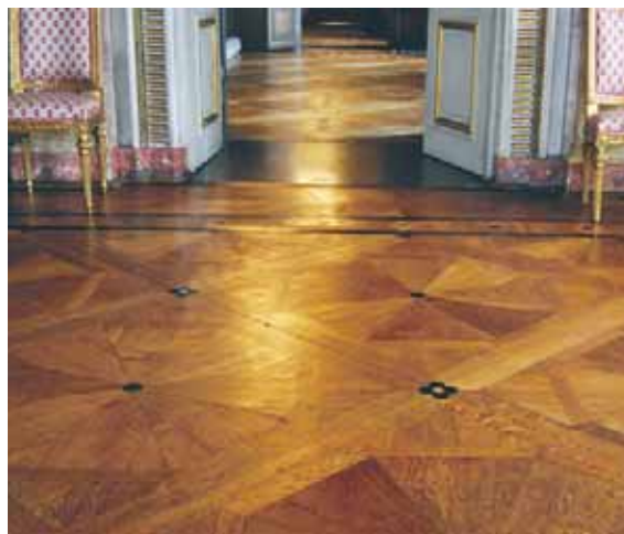
Bonvaxat golv på Stockholms slott.

OBS! Lacknafta är brandfarligt. Följ anvisningar för hantering och förvaring.