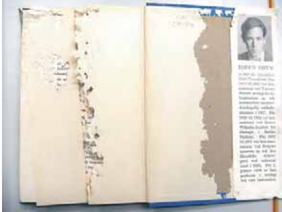
Här har silverfisken varit framme.