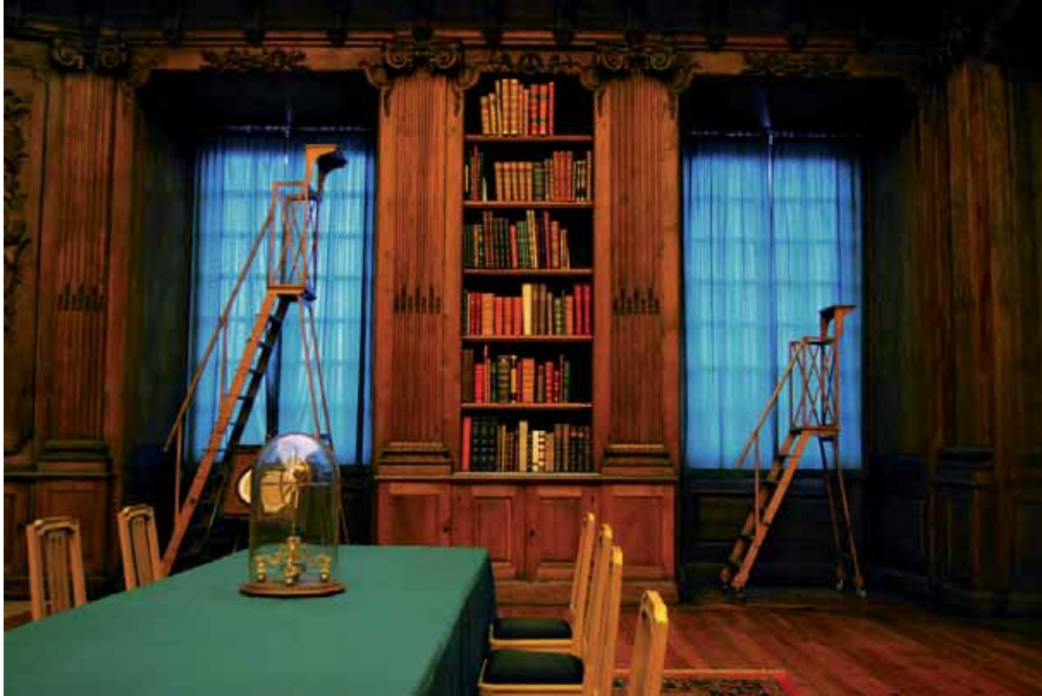
Att dra för gardiner förlänger livslängden betydligt för de vackert skurna träpanelerna och böckerna i Bernadottebiblioteket. Textilier och möbler av trä tar skada av dagsljus även under molniga dagar.