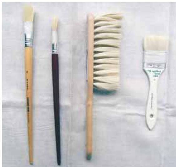
Exempel på borstar att använda på känsliga ytor. Från vänster två svinhårspenslar, en större gethårsborste och en mindre.