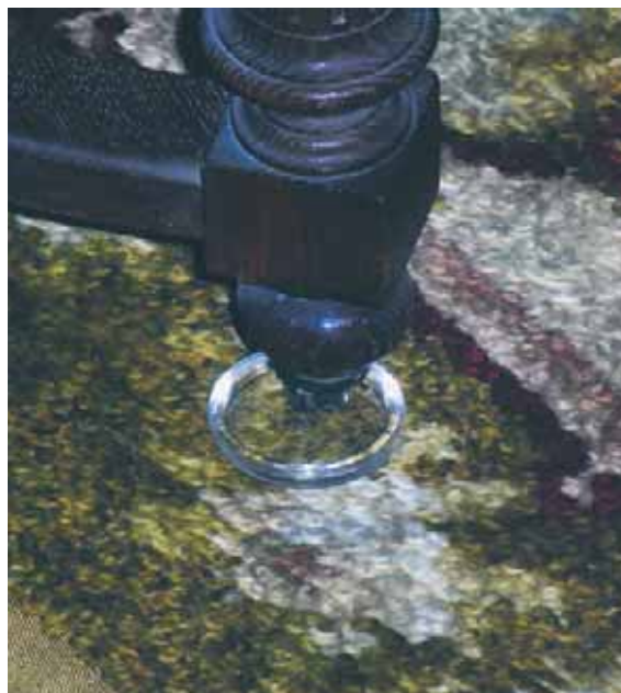
Möbelunderlägg av glas skyddar mattan från märken från metallhjulet på stolen.

Plast- och gummibackning under en matta eller halkskydd kan lämna efter sig fula spår på golvet, inte bara på linoleum som på bilden, men också på