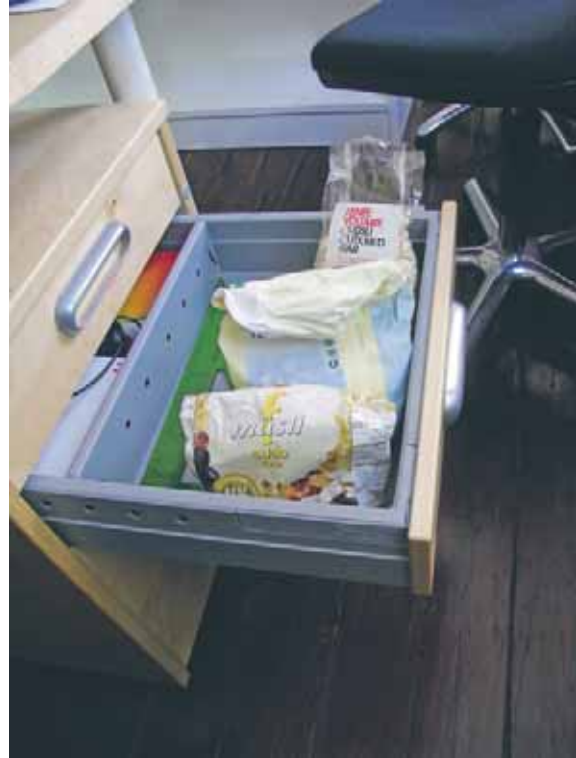
Förvara matvaror i pentry eller kök, inte som här vid arbetsplatsen på kontoret.