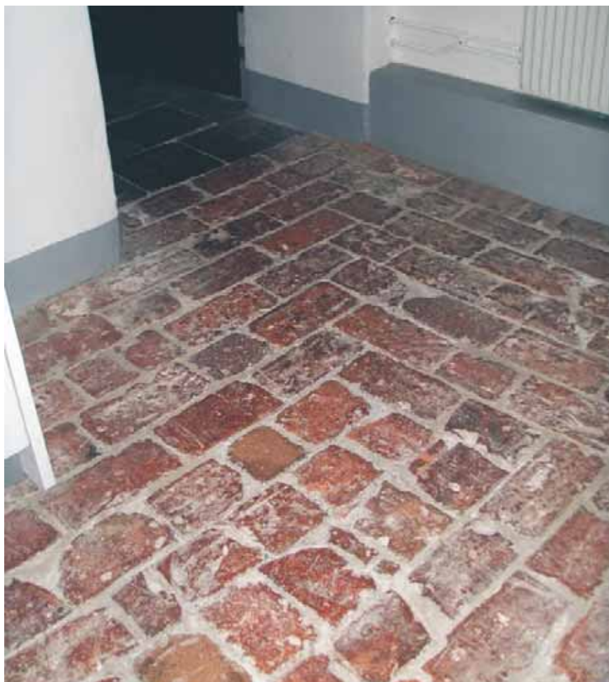
Tegelgolv med lösa fogar i Södra Bankohuset.

OBS! Man kan inte olja, såpaskura eller lägga på en skyddande hinna på tegelgolv med lösa fogar.