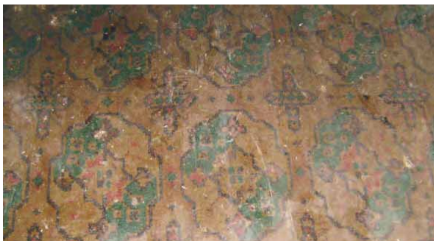
Bilden visar ett exempel på ett ”pensionerat” linoleumgolv från början av 1900-talet. Det finns i vindskammaren i Grindstugan på Drottningholm.