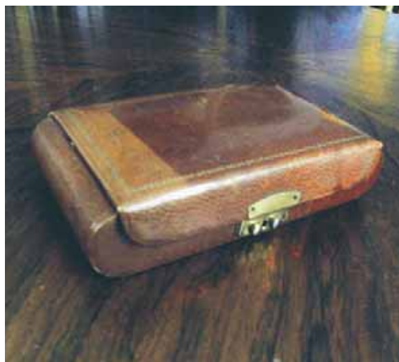
Det här lilla läderskrinet har bleknat eftersom ett annat föremål legat ovanpå och skyddat ett område mot ljusets skadliga verkan.