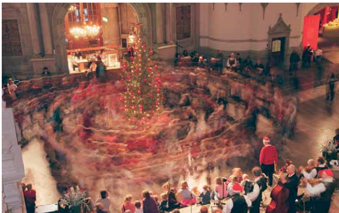
Flera av SFV:s byggnader erbjuder fina lokaler för uthyrning, till exempel stora fester. Det är viktigt att kunna erbjuda detta utan att göra avkall på de kulturhistoriska värdena. Här är juldansen i full gång på Nordiska museet.

Det är en speciell känsla att få gå på fest, konferens eller möte i SFV:s byggnader. Miljöerna innehåller mycket historia och interiörerna kan vara väldigt vackra. Som förvaltare, husfru och lokalvärdare har man emellertid ett stort ansvar att skydda byggnaderna och interiörerna mot skador. Det är viktigt att ta ställning till vilka slags evenemang som ska tillåtas. Man kan ställa sig frågor som: