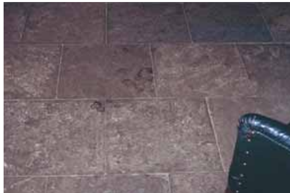
Rödvinfläckar på ett stengolv dagen efter festen. Allt spill måste åtgärdas omedelbart, annars kan det vara för sent. Man kan förebygga detta genom att inte tillåta att folk går omkring med rödvinsglas under fördrinken.