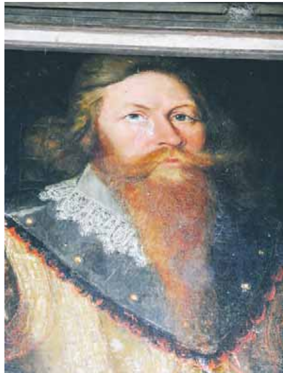
Det förekommer ibland att fåglar lyckas ta sig in i byggnaderna. Här har en fågel smitit in och lyckats smutsa ned målningen.