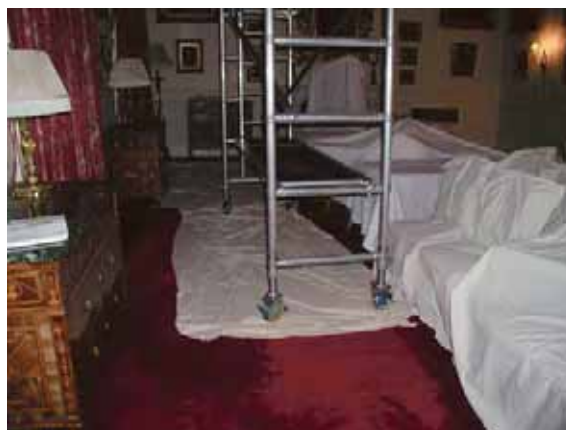
En rullställning bör ha stora hjul som inte skadar underlaget.

Fakta: Damm skapas av liv och rörelse. Det är vi människor som lämnar efter oss hudflagor, textilfibrer, hårstrån och annat som blir till damm. Om damm blir liggande över vintern, och den relativa luftfuktigheten blir hög eller varierar, finns en risk att dammet cementeras. Det innebär att damm och smuts bildar ett kemiskt band med ytan det ligger på. I längden kan det bli omöjligt att ta bort. Att ta bort säsongens damm på hösten är därför en bra förebyggande åtgärd.