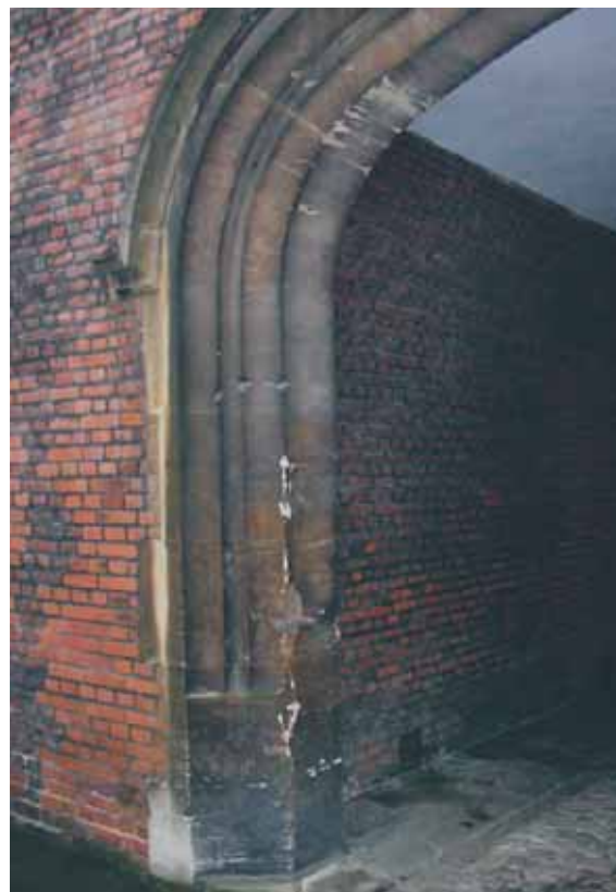
Bilden visar ett engelskt stenvall med anor från 1500-talet. Skadorna uppstod när man ville köra in en last som var för stor.