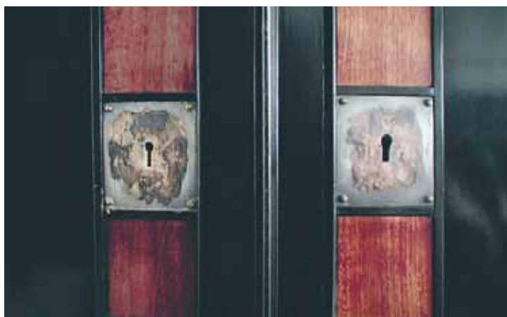
Bilden visar nyckelhål vars tunna hinnor av silver slitits bort av ivrigt putsande. Det räcker med att borsta bort damm från förgyllda föremål.