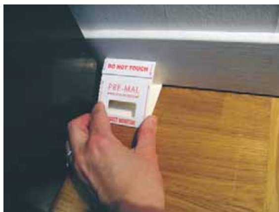
Här ser vi en klisterfälla som är placerad längs med en vägg.