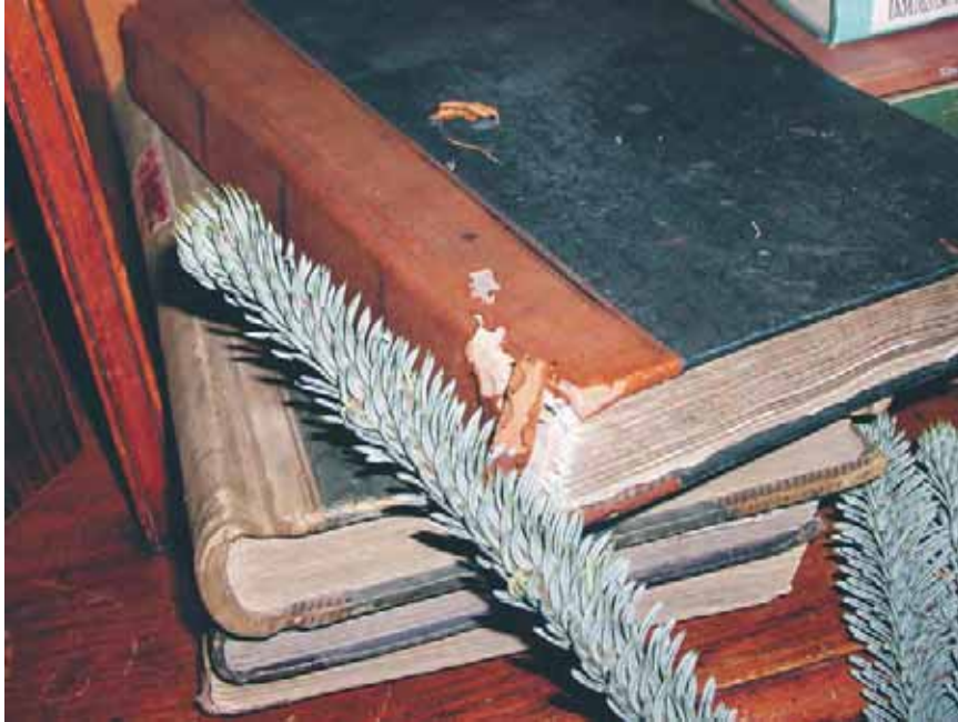
Grankvisten på bilden har skrapat några ömtåliga böcker.