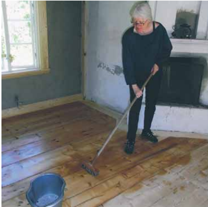
Skura golvet i träets längdriktning med skurborste på skaft.