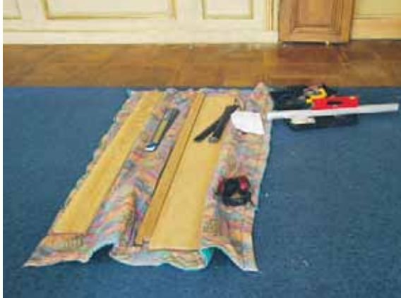
Här visas ett bra exempel på förvaring av verktyg då entreprenören utför ett arbete.