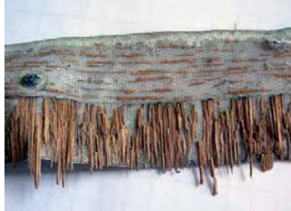
Stark tejp kan förstöra ett helt golv och ska inte användas i känsliga miljöer. Tejpen på bilden tog med sig en bit av golvet när den revs bort. Det finns blå tejp som konservatorer använder. Den har en lägre vidhäftningsförmåga, men fungerar ändå bra. Allra helst bör tejp undvikas.