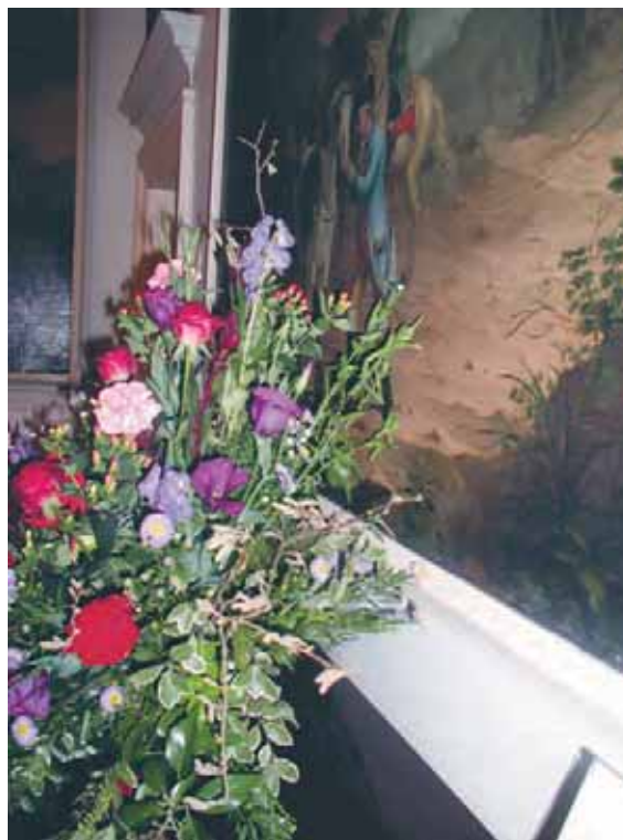
Bör blomsteruppsättningen stå så nära tavlan? Kvistar och blad riskerar att rispa ytan.