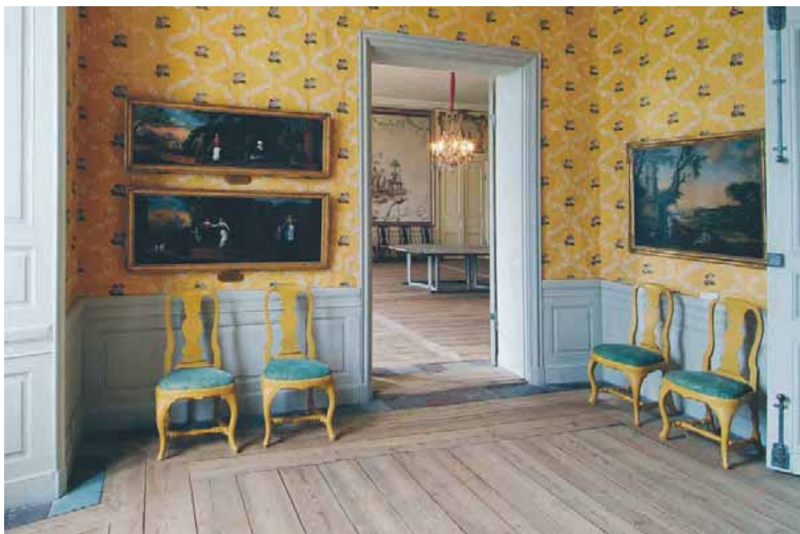
Strömsholms slott. Förmaket till kronprinsens sängkammare.

Det är ett privilegium att arbeta i en miljö som bär spår av historiens vingslag och som är en del av vårt kulturarv. Den här typen av miljö är dock känslig för slitage och andra påfrestningar. Daglig verksamhet i en känslig miljö ställer därför vissa krav på dem som arbetar här. Om något skadas är det inte bara att reparera eller köpa nytt. Skador på interiörer och föremål kan leda till omfattande konserveringsåtgärder samtidigt som en del av äktheten går förlorad.