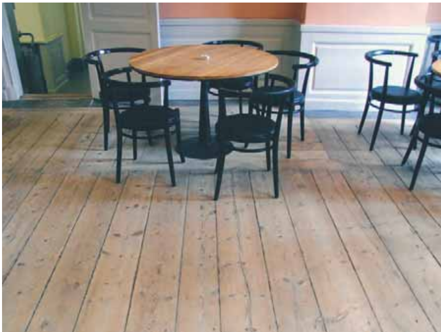
Såpaskurat trägolv i personalköket i Södra Bankohuset på SFV:s huvudkontor.