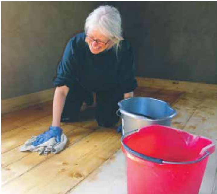
Skölj golvet med vatten. Här används en skurtrasa. Vrid ur trasan i en hink, skölj i den andra. Handskar och knäskydd underlättar skurningen väsentligt.