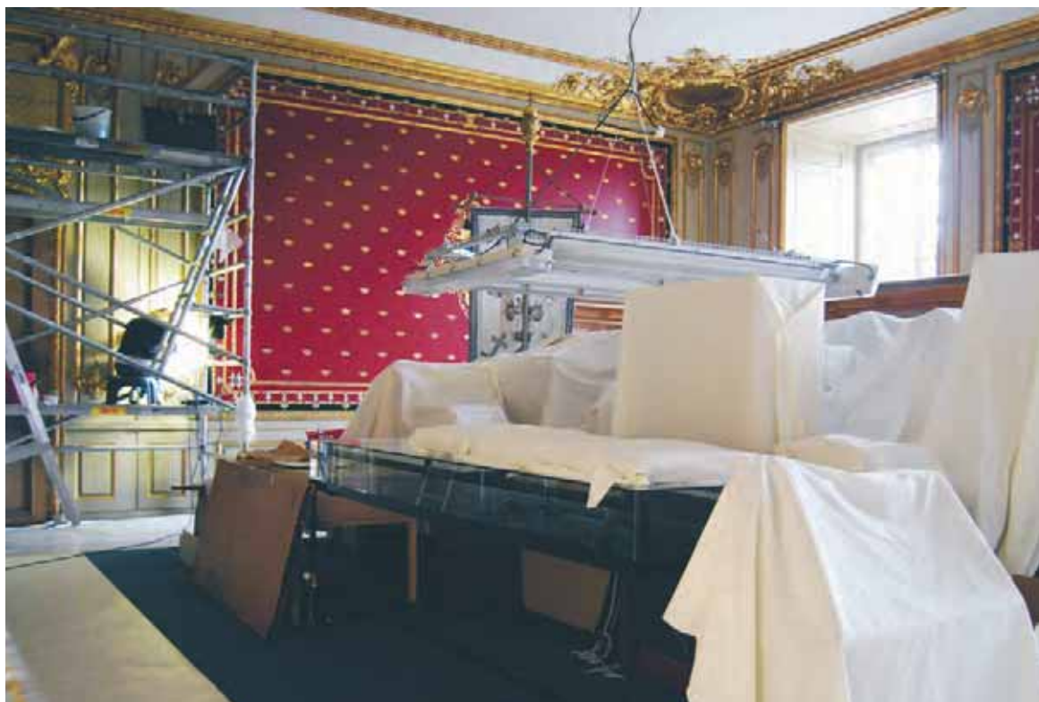
Möblerna täcks med dammöverdrag inför hantverkarnas arbeten i rummet.

Följ arbetsmiljölagen, när det gäller heta arbeten. Tillstånd måste sökas och lämnas. Varje anlägg-