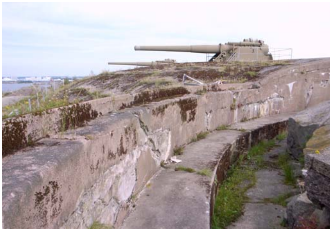
Två kanoner är återmonterade.