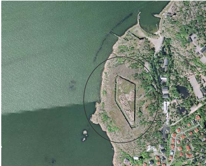
Göta älvs södra udde vid inloppet till Göteborg.