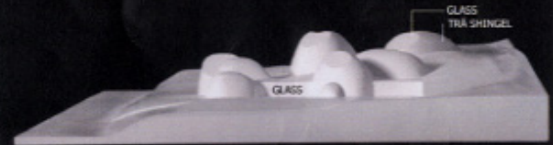
FASAD MOT SÖDER 1/400