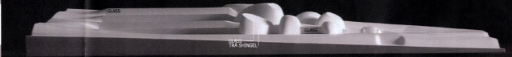
FASAD MOT VÄSTER 1/400 FASAD MOT ÖSTER 1/400