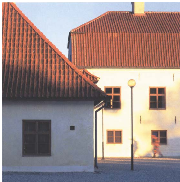
Roma kungsgård byggdes på 1730-talet och är unik för Gotland, där det inte finns någon tradition för symmetriskt anlagda sätesgårdar.

Mitt på Gotland ligger Roma, öns centrala plats, där gutarna sedan urminnes tider samlades till rättskipning och kult. «De offrade då sina söner och döttrar och sin boskap och bedrev blot med mat och dryck. Detta gjorde de enligt sin vantro», berättas det i Gutasagan.