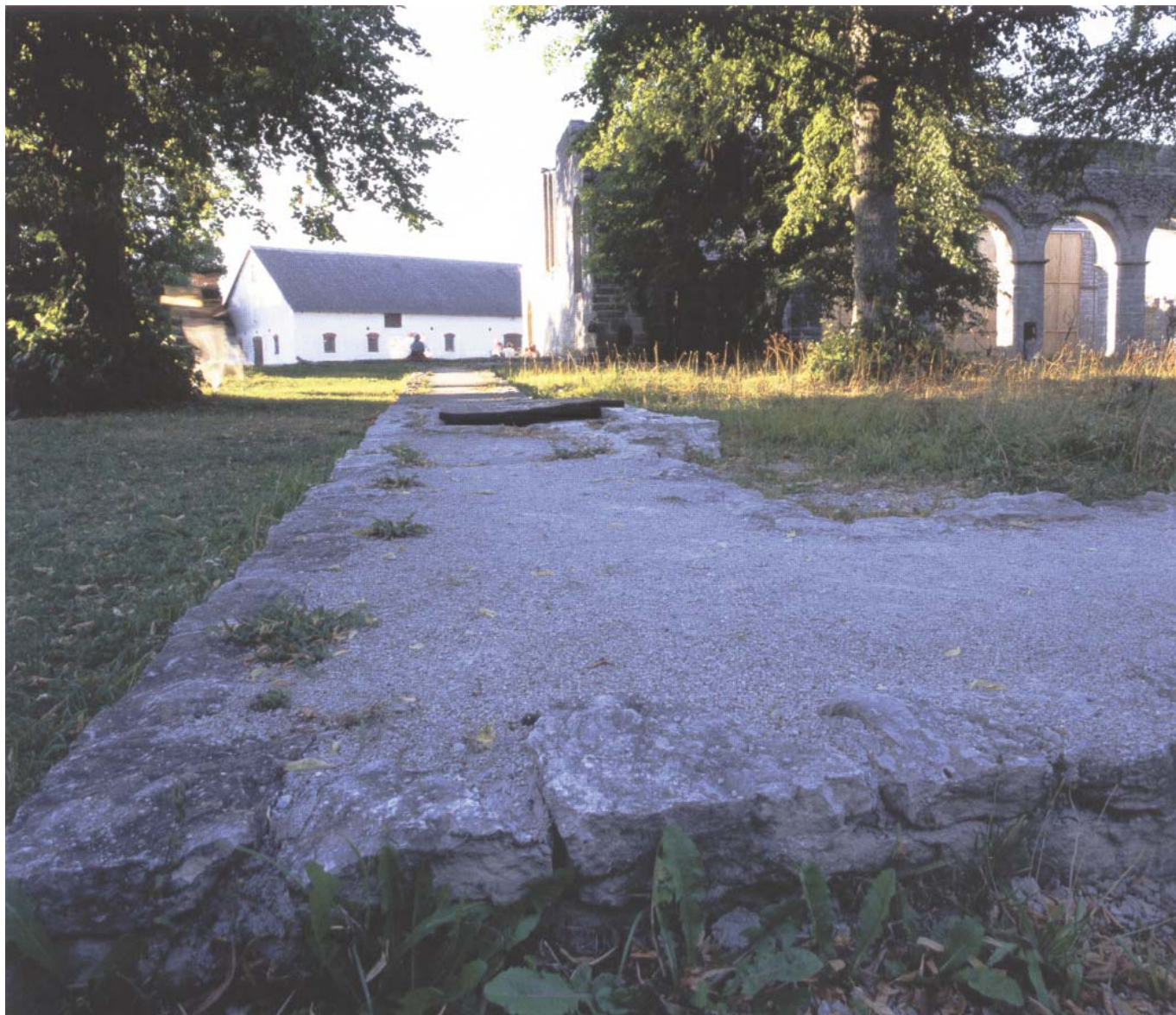
Arkeologerna har grävt fram resterna av klostrets murar, som sedan åter täckts med jord för att bevaras. Låga murar av sten och cement markerar den ursprungliga anläggningens läge.

och de gotländska bosättningarna vittnar om enstaka gårdar på relativt stort avstånd från varandra. Gotland har inte haft någon bybildning förrän i sen tid. Gårdarna byggdes som borgar omgärdade av höga murar eller stängsel. Rövarband som härjade till sjöss och på land känner man till, men gutarnas egen krönika, Gutasagan från år 1220, nämner också många kungar som strider om inflytande över ön.